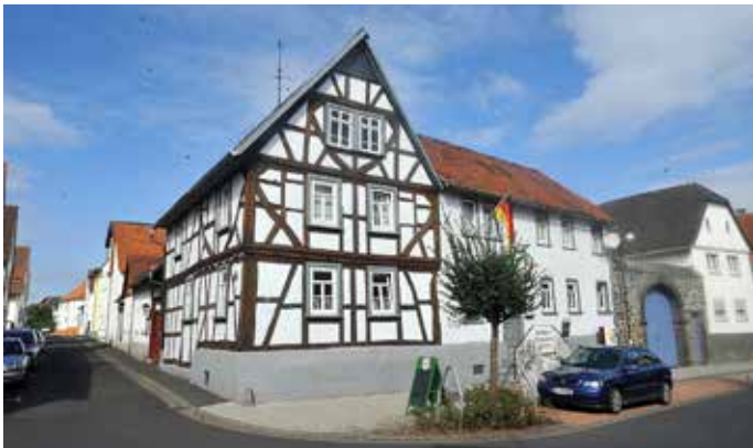
Schnitzelhaus „Schröder“, Leihgestern