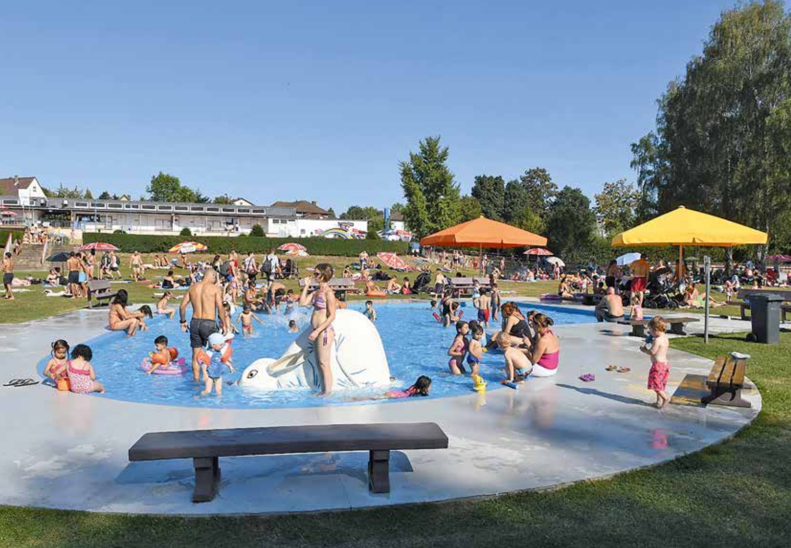
Planschbecken im Freibad der Stadt Linden