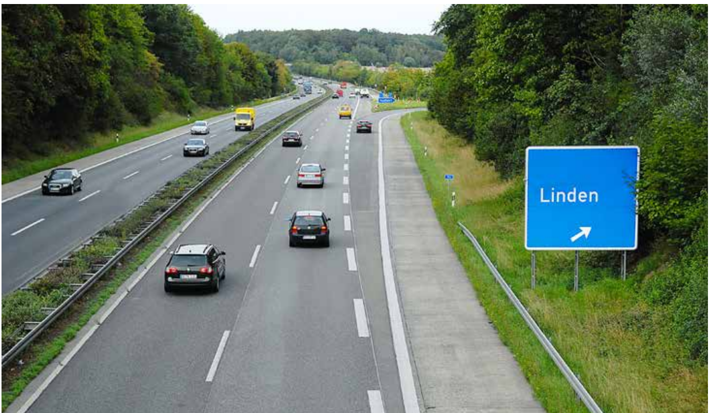
A 485, Abfahrt Linden

Weimarer Straße 18 · 35440 Linden · Tel. 0 64 03/96 32 80 · www.cdu-linden.de · mail@cdu-linden.de