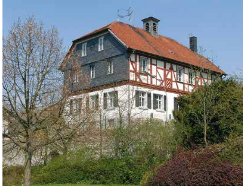
Evangelisches Gemeindehaus in Großen-Linden

Turnverein - Breitensport Ludwigstraße 9, 35440 Linden 06403 72894 info@tv-g-linden.de Vorsitzender: Josef Semmelroth 06403 963200 oder 0172 6765673 geschaeftsstelle@tv-g-linden.de www.tv-g-linden.de