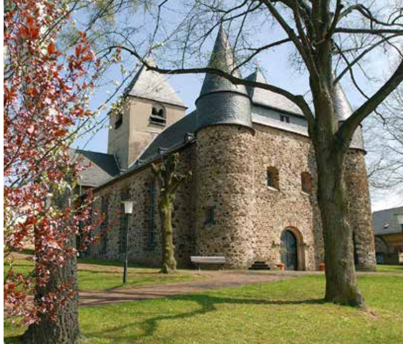
Evangelische Kirche in Großen-Linden

Offizieller Start des schnellen Internet in Linden, nach dem erfolgreichen Breitbandausbau durch die Deutsche Telekom. Bereits am 13. April hatte dazu eine zweite Bürgerinformationsveranstaltung stattgefunden - im Oktober waren 2.700 Haushalte in Großen-Linden angeschlossen worden.