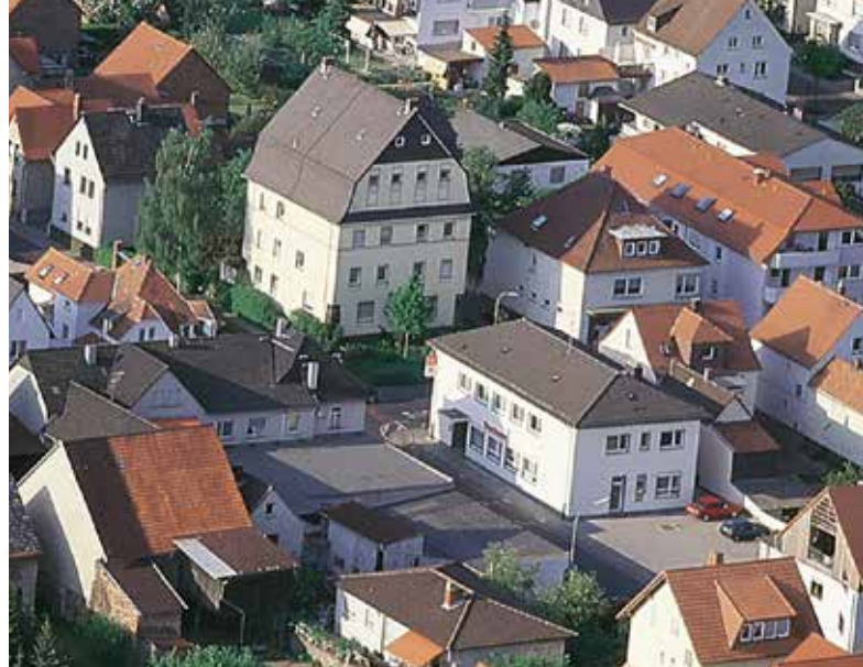
Luftaufnahme „Wasserhaus und Umgebung“ in Großen-Linden