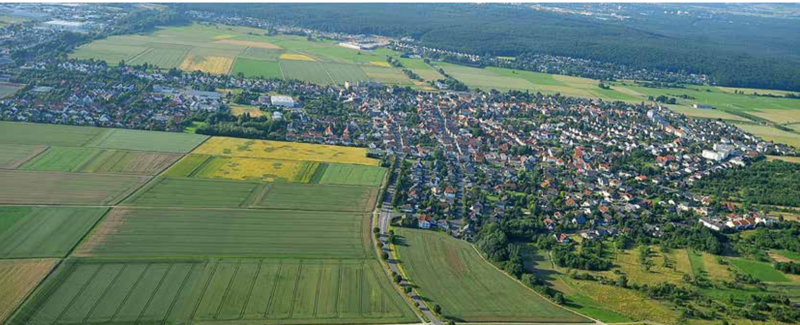
Luftaufnahme Stadtteil Leihgestern