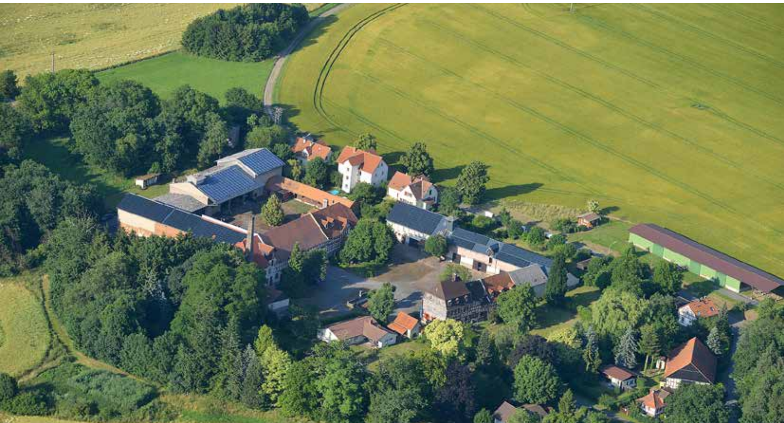
Luftaufnahme Gut Neuhof in Leihgestern