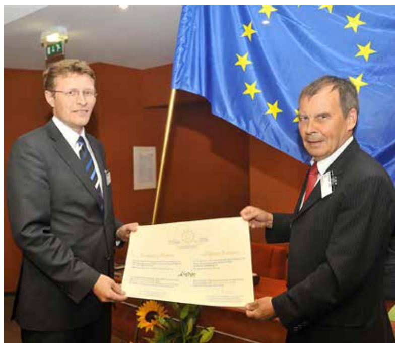
Europadiplom für Linden