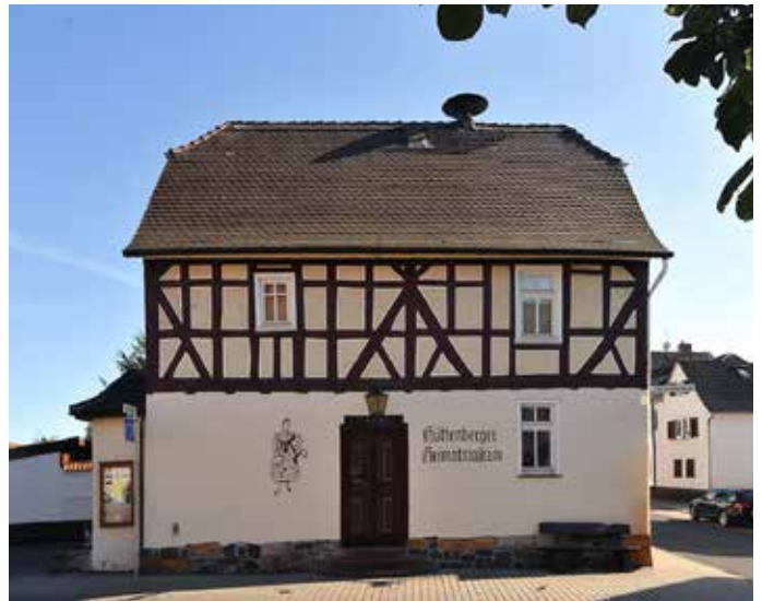
Hüttenberger Heimatmuseum in Leihgestern