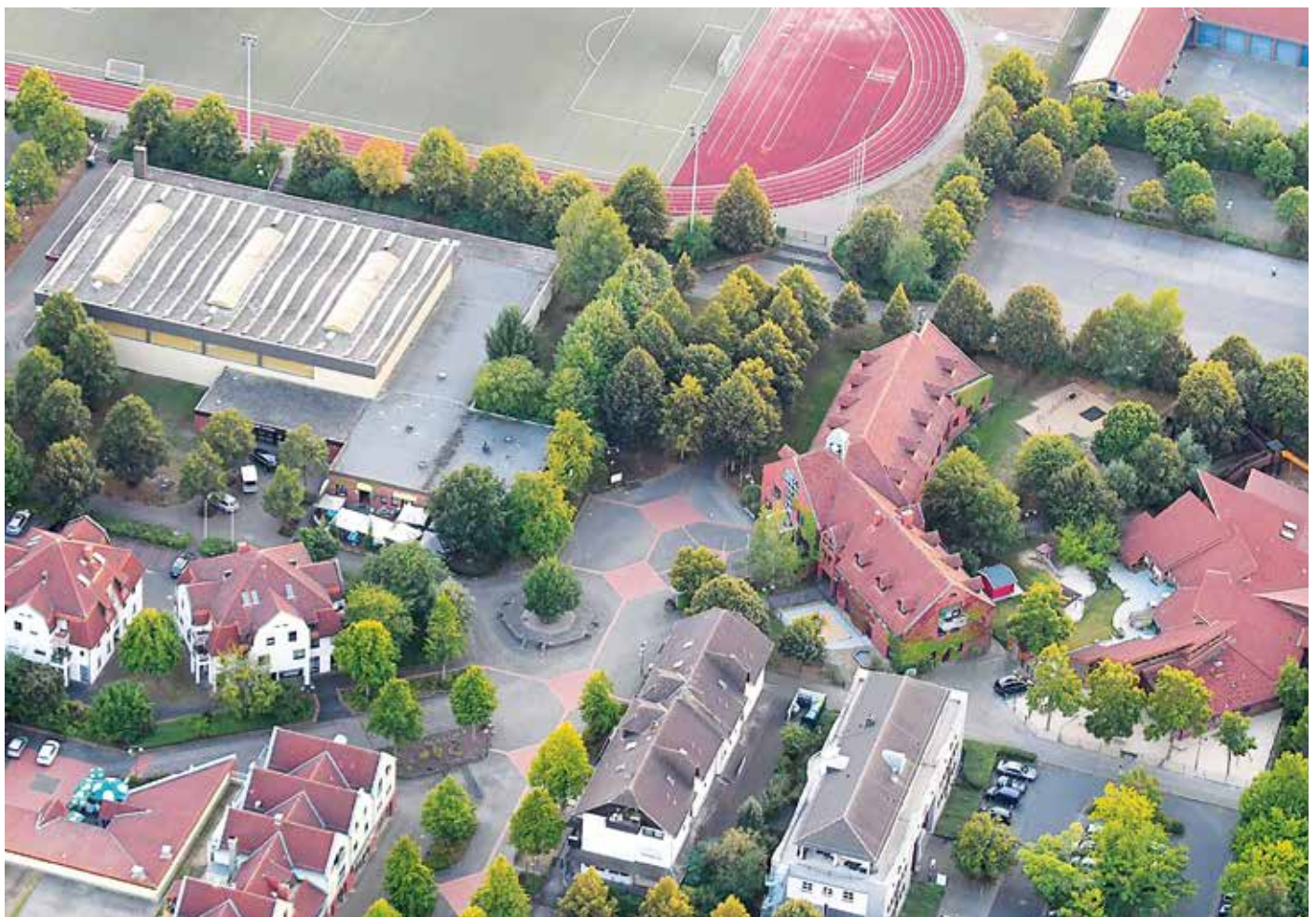
Luftaufnahme Stadtzentrum mit Rathaus, Kindergarten, Stadthalle, Stadion, Bauhof und Gaststätte Ratsstublen

Gernot Rödl Jenaer Straße 3, 35440 Linden 06403 1519 gernot.roedl@t-online.de