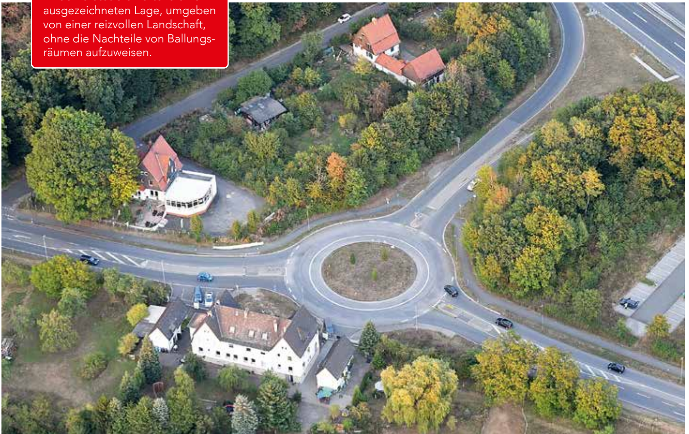
Autobahnabfahrt Linden an der A 485

Linden bietet die Vorteile einer ausgezeichneten Lage, umgeben von einer reizvollen Landschaft, ohne die Nachteile von Ballungsräumen aufzuweisen.