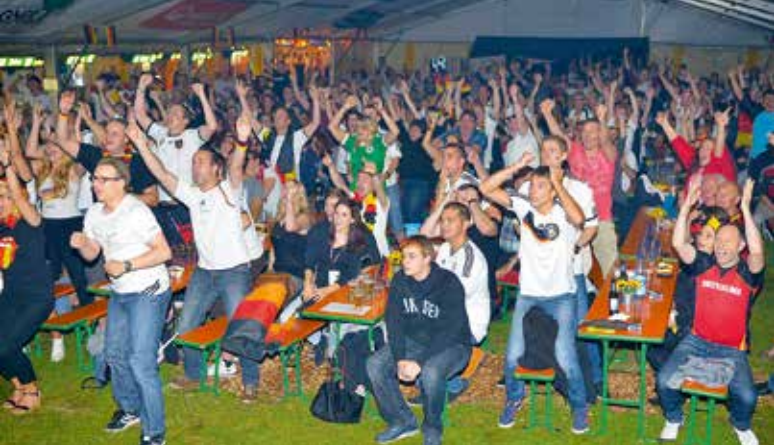
Jubel im Zelt

Eine 26-köpfige Delegation aus Warabi/Japan trifft in Linden ein – vier Tage später kommen noch vier weitere Delegationsmitglieder, darunter Oberbürgermeister Hideo Yoritaka nach Linden, wo sie im Rahmen des 19. Freundschaftstreffens zu Gast sind. Im Rathaus trägt sich der außerordentliche und bevollmächtigte Botschafter von Japan in der Bundesrepublik Deutschland, Takeshi Nakane ins Goldene Buch der Stadt ein.