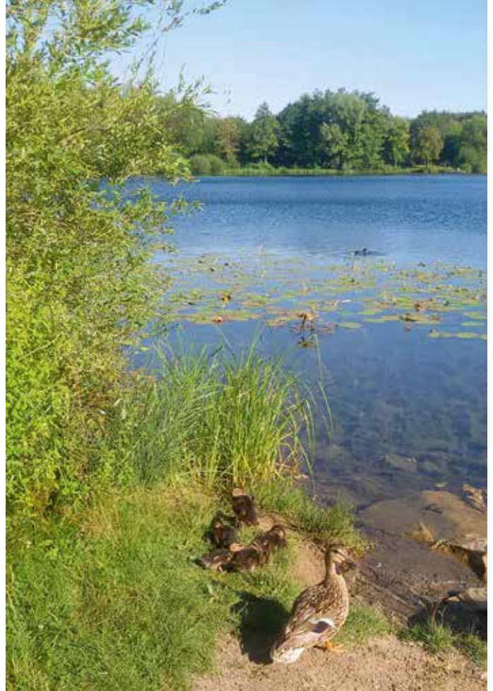
Entennachwuchs in der „Grube Fernie“

Vixröder Straße 16, 35396 Gießen 0641 52251 www.tsv-giessen.de