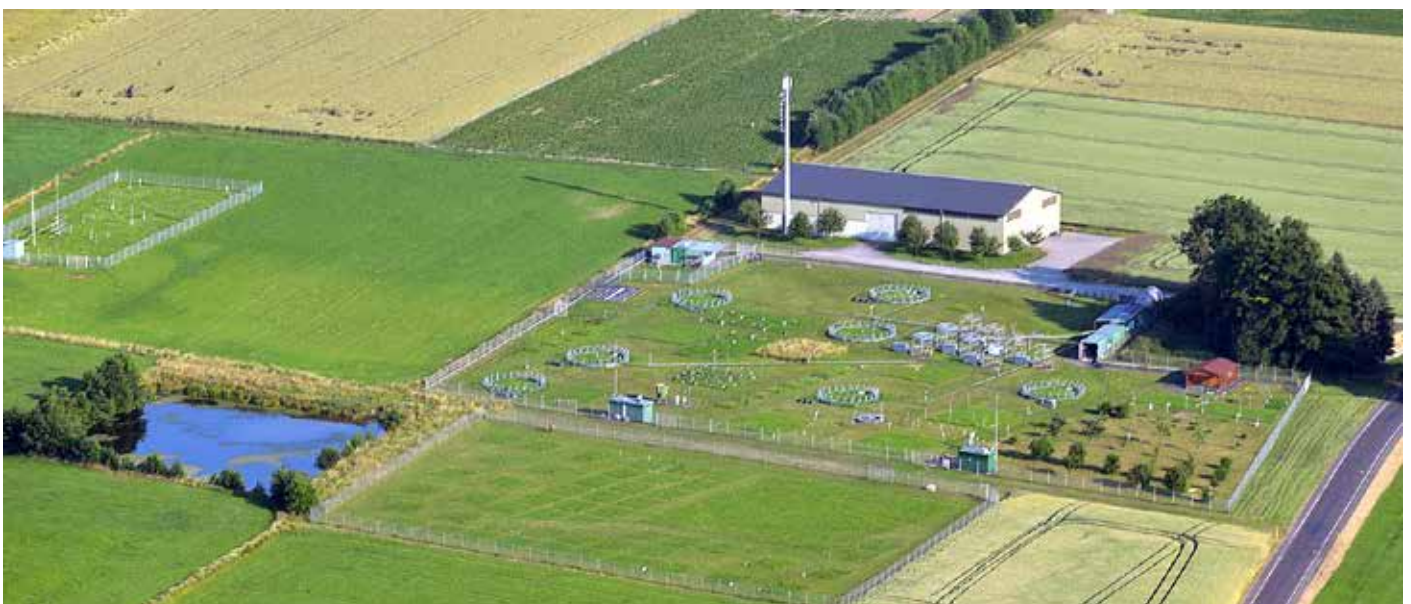
Umweltbeobachtungs- und Klimafolgenforschungsstation Linden, im Steinweg, betrieben durch das Institut für Pflanzenökologie der Justus-Liebig-Universität (JLU) Gießen und dem Hessischen Landesamt für Umwelt und Geologie.