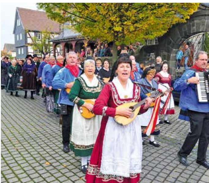
Trachtenumzug in Leihgestern

125 Jahre Obst- und Gartenbauverein Großen-Linden werden mit einem Festwochenende in und um das Musikcorps-Vereinsheim gefeiert.