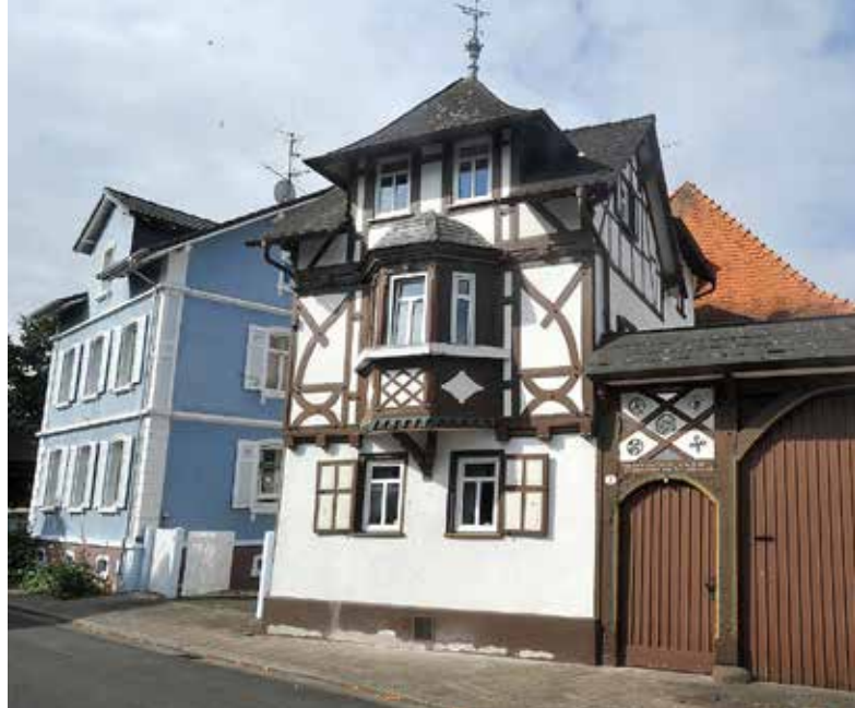
Fachwerkhaus in der Obergasse in Großen-Linden

Am 15. September 2011, nach rekordverdächtig Vorbereitungszeit von nur knapp sechs Monaten, ist das Vorhaben nun perfekt: Mit der Unterzeichnung des Pachtvertrages mit der Stadt Linden für das Grundstück „Auf dem Bruch“ und dem Errichtungs- und Kaufvertrag mit der Firma Wagner Solar ist der unmittelbare Startschuss für den Bau einer der größten Photovoltaik-Freiflächenanlagen in der Region gefallen. Hier entsteht der „Solarpark Linden“. Am 23. Dezember 2011 wird er ans Netz angeschlossen.