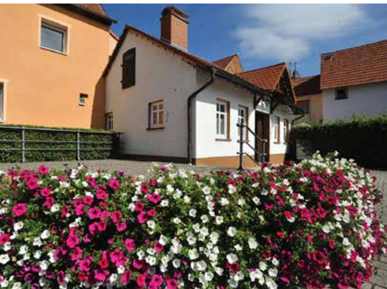
Heimatstube in Leihgestern