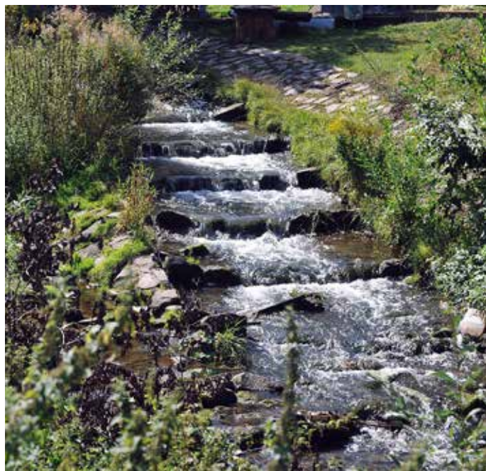
Die Fischtreppe im Kleebach hinter der Mühle in der Frankfurter Straße