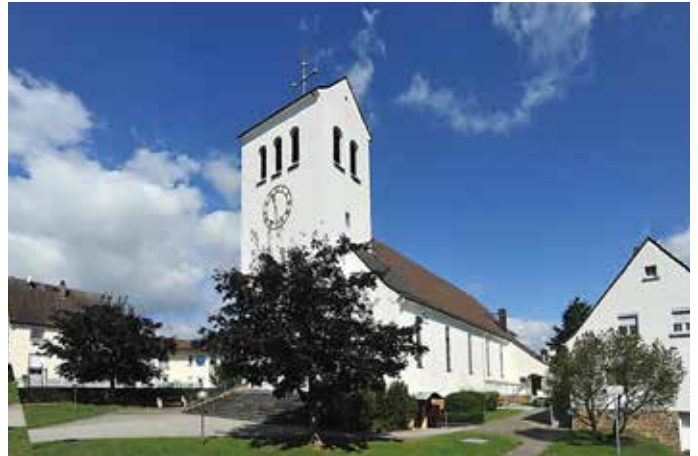
Katholische Christkönigskirche in Großen-Linden