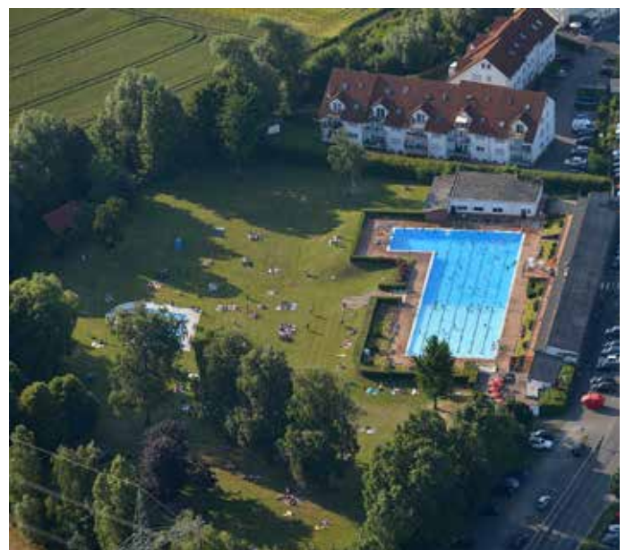
Das Schwimmbad aus der Vogelperspektive

1952 Durch Initiative einiger Großen-Lindener Bürger wird ein Freibad angelegt, später von der Stadt übernommen und bis heute zu einer im Sommer gern besuchten Freizeiteinrichtung ausgebaut.