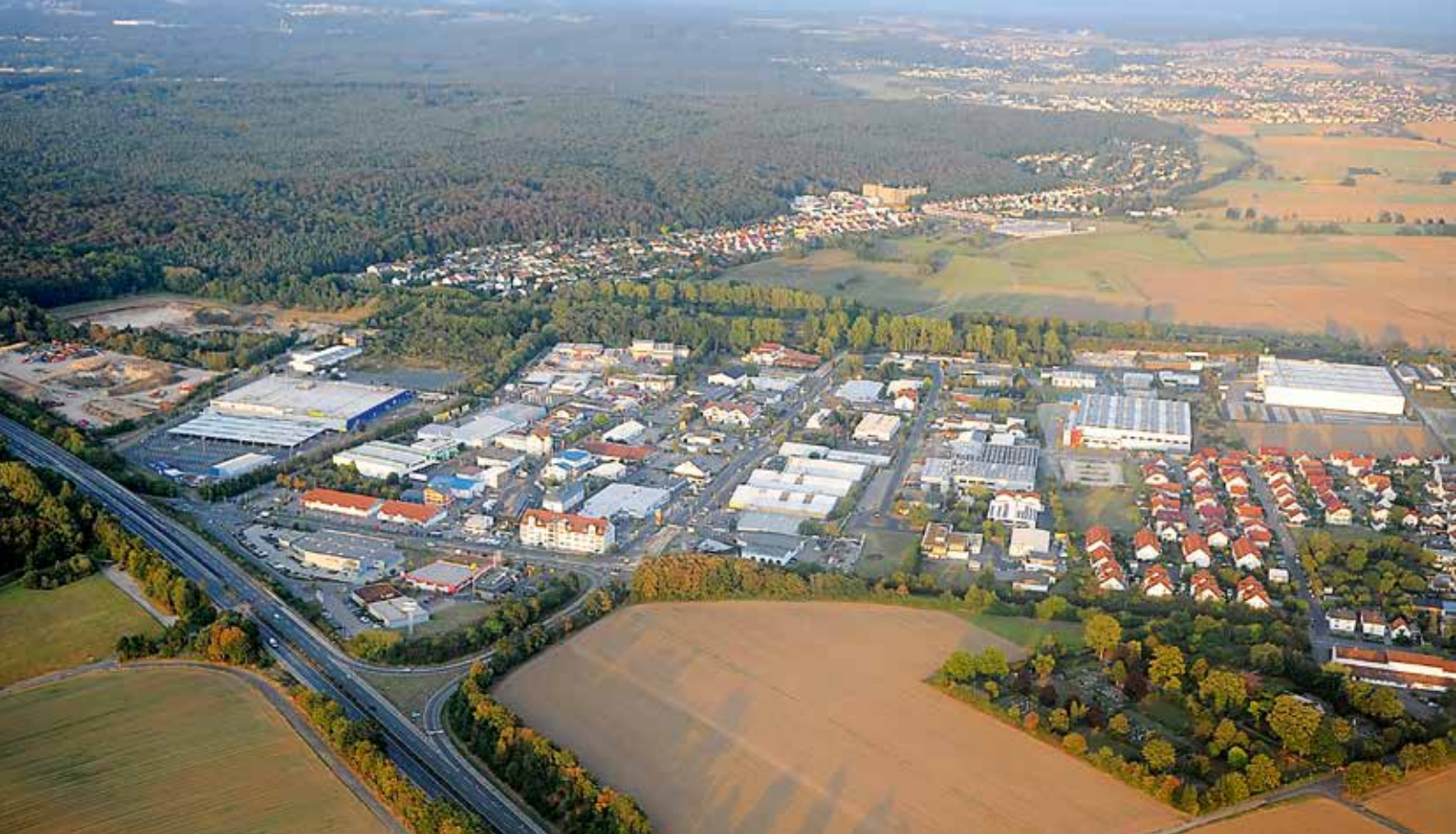
Luftaufnahme Gewerbegebiet Lücke bachtal an der A485, im Hintergrund Linden-Forst