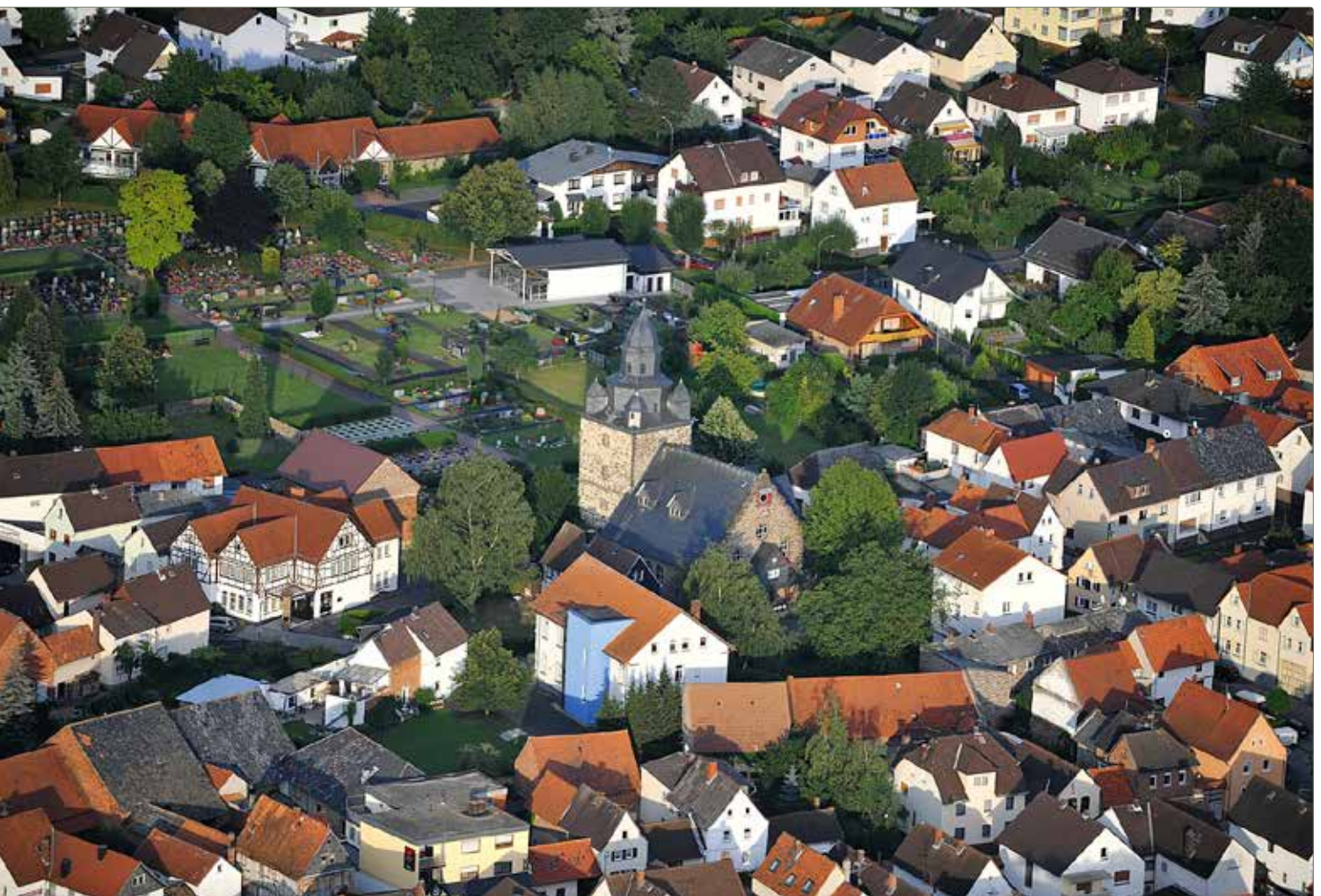
Luftaufnahme evangelische Kirche Leihgestern