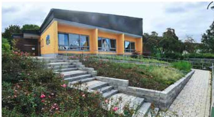
Kindergarten Obergasse Großen-Linden

Marburger Straße 4, 35390 Gießen 0641 9340