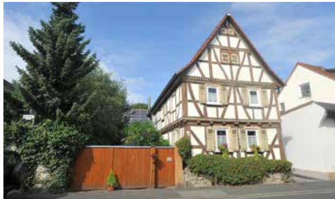
Fachwerkhaus in der Kirchstraße, Leihgestern