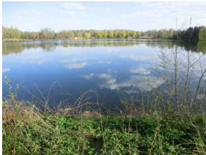
Impression in der „Grube Fernie“ - Naherholungsgebiet in Linden

Die Dienstbereitschaft der Apotheken wird durch einen Nacht- und Notfalldienst sichergestellt, der täglich wechselt. Die jeweils diensttuende Apotheke wird in den „Lindener Nachrichten“ bekanntgegeben.